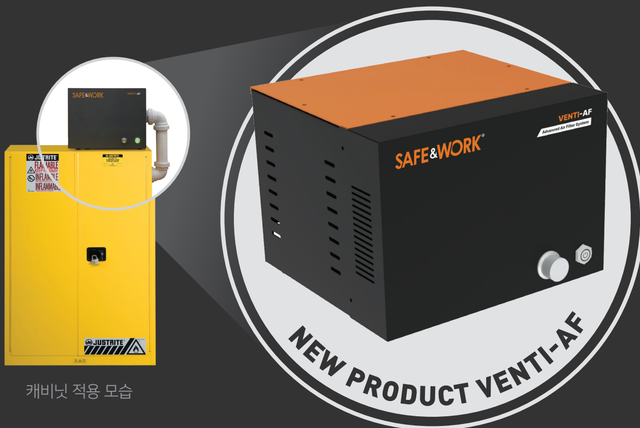
캐비닛 적용 모습