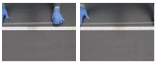
기존 자사 제품 : 최대 5배 Seal-R-film : 최대 10배