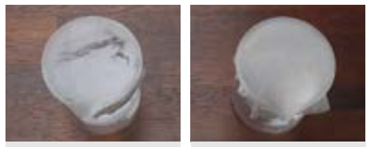
기존 자사 제품 Seal-R-film